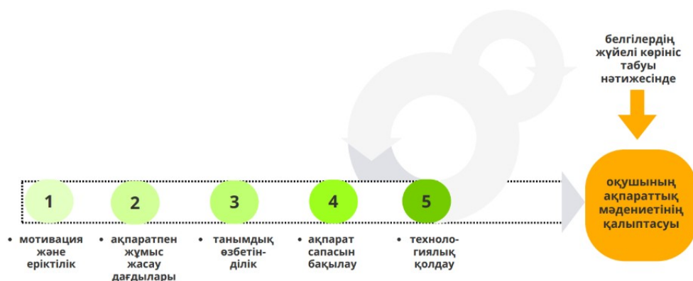
Сурет 1: Бастауыш сынып оқушыларының ақпараттық мәдениетінің қалыптасу белгілері

1-суретте көрсетілген белгілерге қысқаша сипаттама: